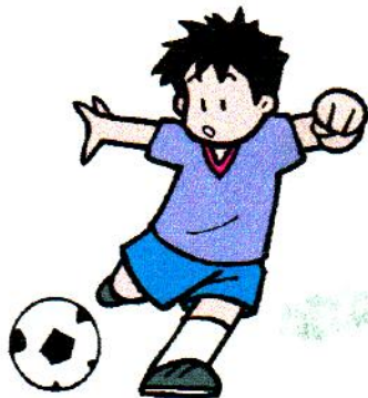
W il Crotonese in serie B

Finita la partita, i tifosi hanno fatto una invasione ,e altri insieme ai giocatori hanno fatto il bagno nella fontana . Un corteo di macchine ha fatto il giro del centro schiamazzando e gridando e così è finita la serata.